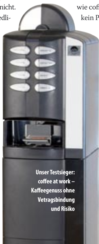
Unser Testsieger: coffee at work – Kaffeegenuss ohne Vertragsbindung und Risiko

Im Anschluss an den Test gaben wir allen getesteten Unternehmen die Möglichkeit durch Werbeanzeigen oder Beilagen weitere Informationen über Ihre Geräte und Verträge darzustellen. Hiervon machte nur die Firma coffee at work mit einer Beilage Gebrauch. Die Firma Cafe Bar übersandte uns darauf hin per Einschreiben die Bitte „keinerlei vorliegende Informationen der Firma Cafe Bar – ohne Genehmigung – in irgendeiner Art und Weise zu veröffentlichen“.